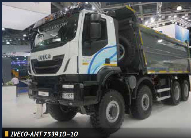
■ IVECO-AMT 753910-10