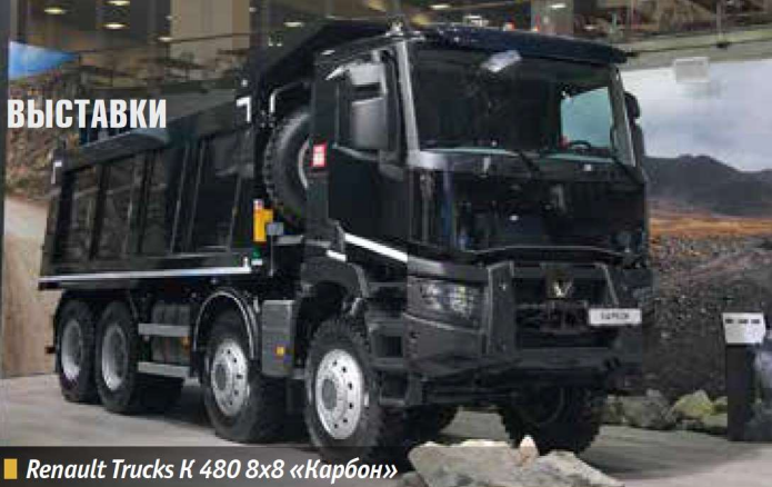
■ Renault Trucks K 480 8x8 «Карбон»