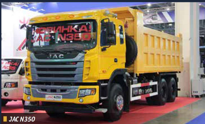
■ JAC N350