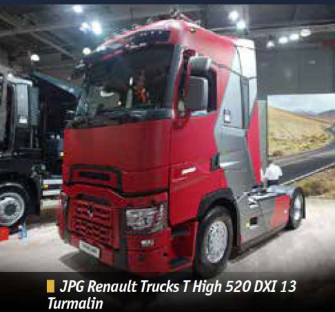
■ JPG Renault Trucks T High 520 DXI 13 Turmalin