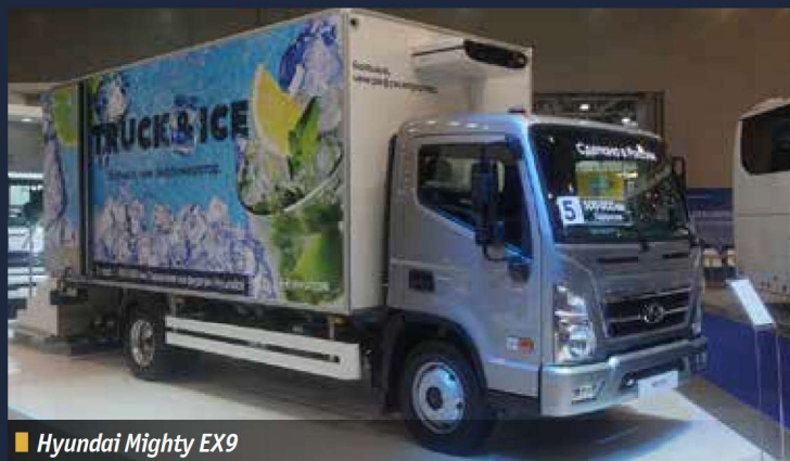
■ Hyundai Mighty EX9