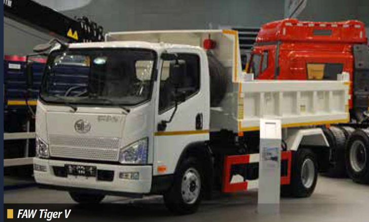
■ FAW Tiger V