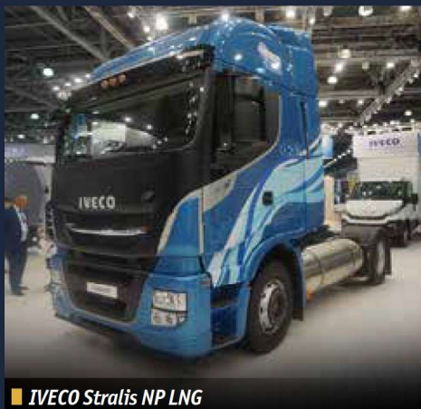
■ IVECO Stralis NP LNG